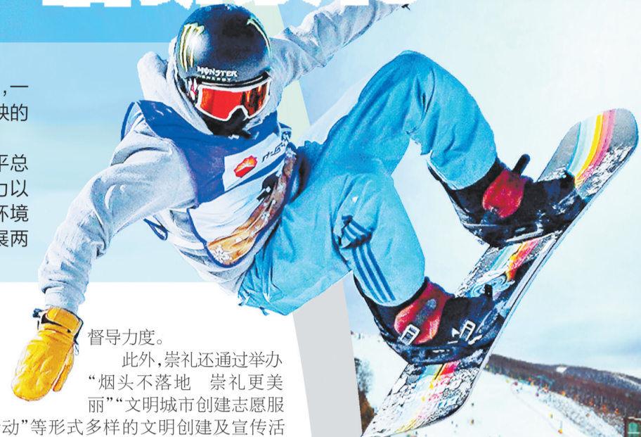
崇礼冰雪旅游度假区获批国家级旅游度假区。