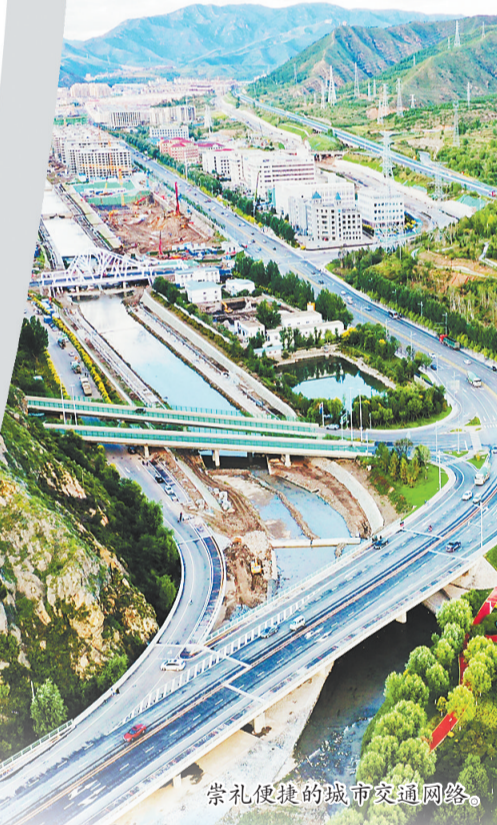
崇礼便捷的城市交通网络。