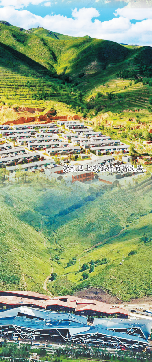
崇礼区上高铺村的新民居。