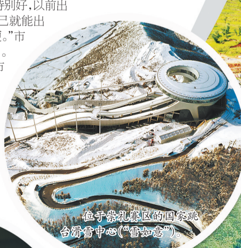
位于崇礼赛区的国家跳台滑雪中心(“雪如意”)。