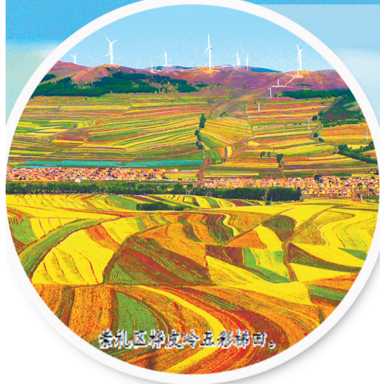
崇礼区秋色五彩斑斓。