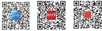
河北日报客户端、微博、微信