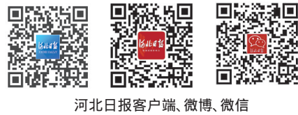
河北日报客户端、微博、微信