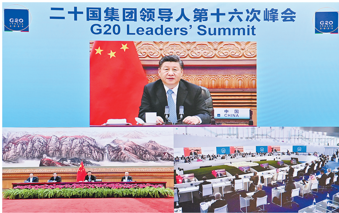
10月31日晚,国家主席习近平在北京继续以视频方式出席二十国集团领导人第十六次峰会。

新华社北京10月31日电 国家主席习近平31日晚在北京继续以视频方式出席二十国集团领导人第十六次峰会,重点阐述对气候变化、能源、可持续发展等问题的看法。