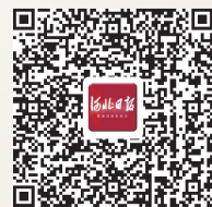
扫描二维码,收看精彩视频

此外,从经济角度看,电影之所以能够成为一个产业,是因为除了电影放映能带来票房收益以外,与电影相关的广告等相关产业皆可“变现”。通过这些年不断攀升的统计数据,我们能够直观感受到中国电影“走出去”取得的成绩,也能总结出不少有益的经验,给创作实践一些启示,更能发现不足和差距,为未来中国电影海外市场发展提供有针对性的改进方向。