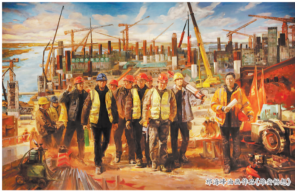
祁海峰油画作品《雄关畅想》