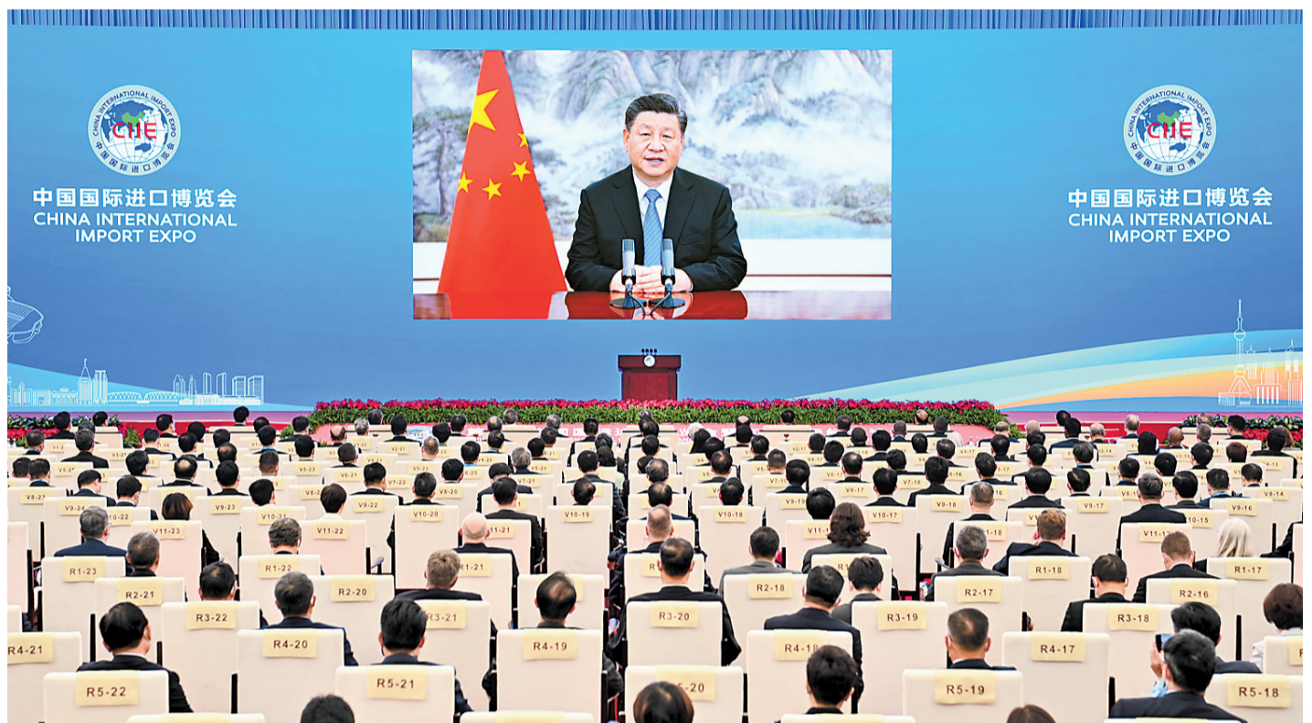
11月4日晚,国家主席习近平以视频方式出席第四届中国国际进口博览会开幕式并发表题为《让开放的春风温暖世界》的主旨演讲。

新华社北京11月4日电 11月4日晚,国家主席习近平以视频方式出席第四届中国国际进口博览会开幕式并发表题为《让开放的春风温暖世界》的主旨演讲。(演讲全文见第二版)