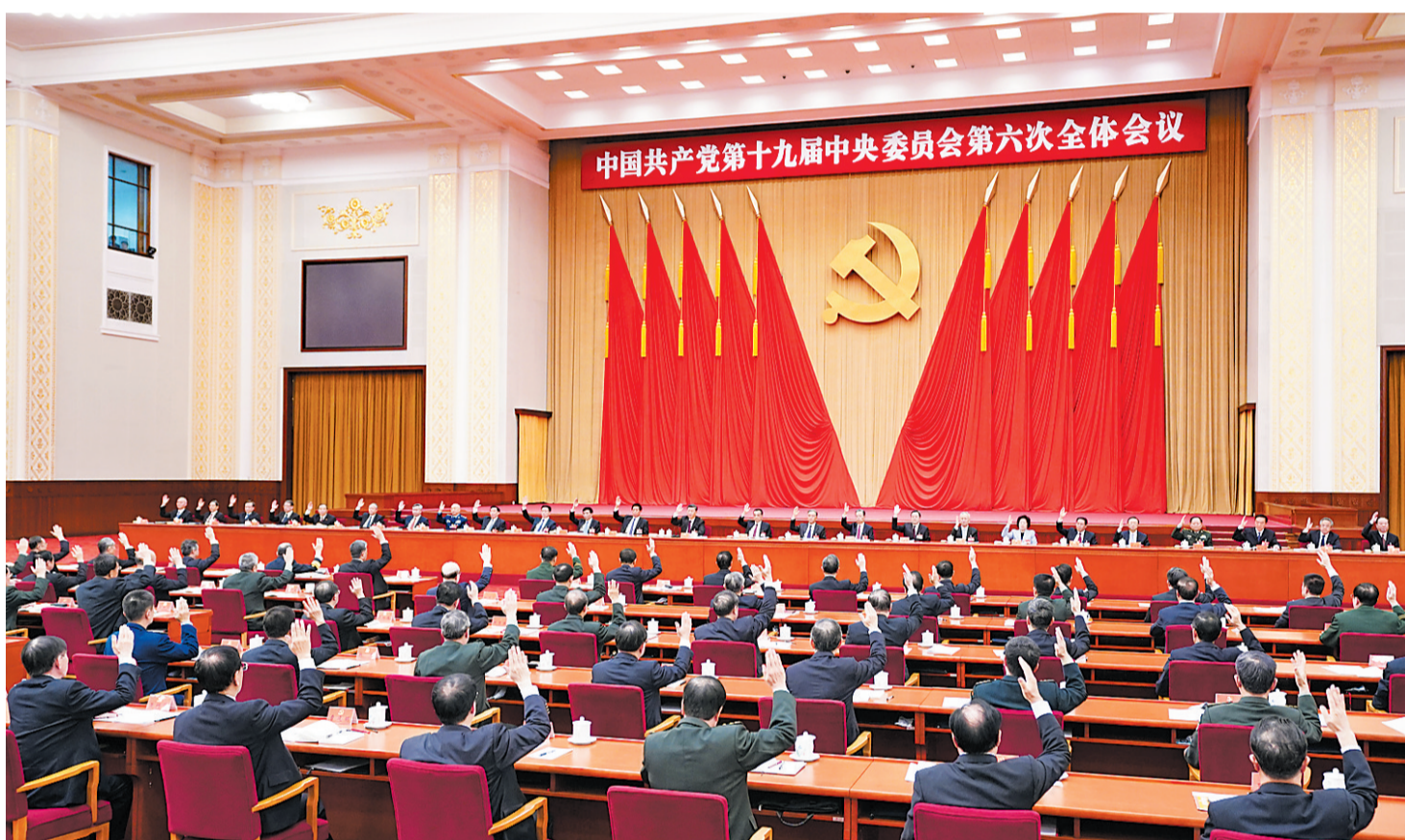
中国共产党第十九届中央委员会第六次全体会议,于2021年11月8日至11日在北京举行。中央政治局主持会议。