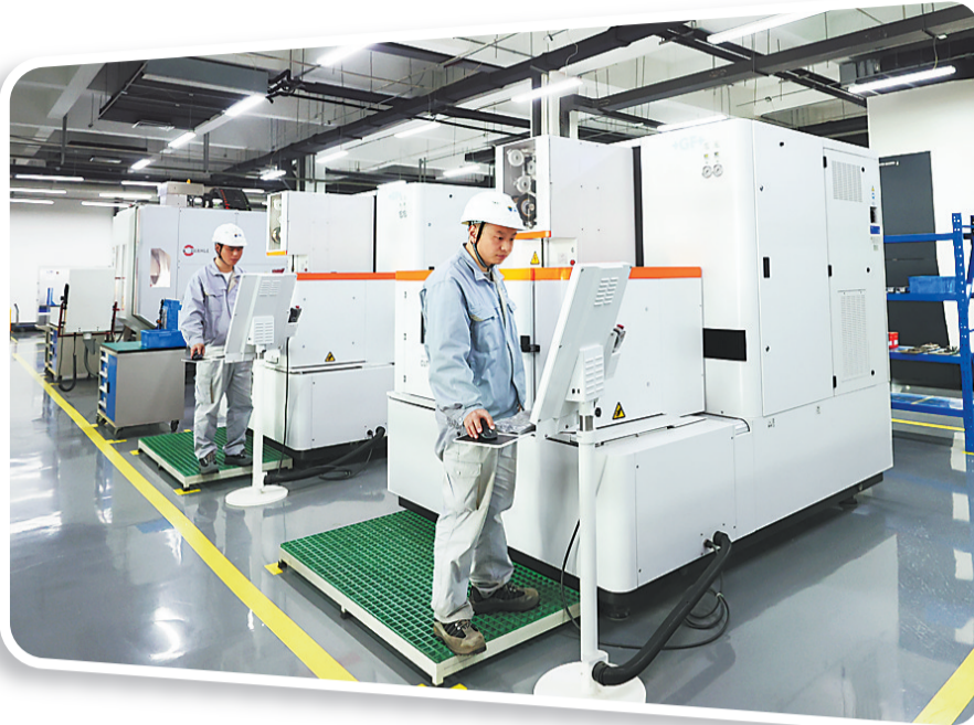
日前,在新奥动力科技(廊坊)有限公司车间精密加工区内,技术人员正在操作慢走丝机床。

目前,全区拥有高层次、高技能人才1.6万余人,拥有国家级科研院所4家、院士工作站5家、博士后研发创新机构12家、各类研发平台133个。前三季度,规上工业企业实现营业收入339亿元,利润总额36亿元,同比分别增长10.8%、7.5%