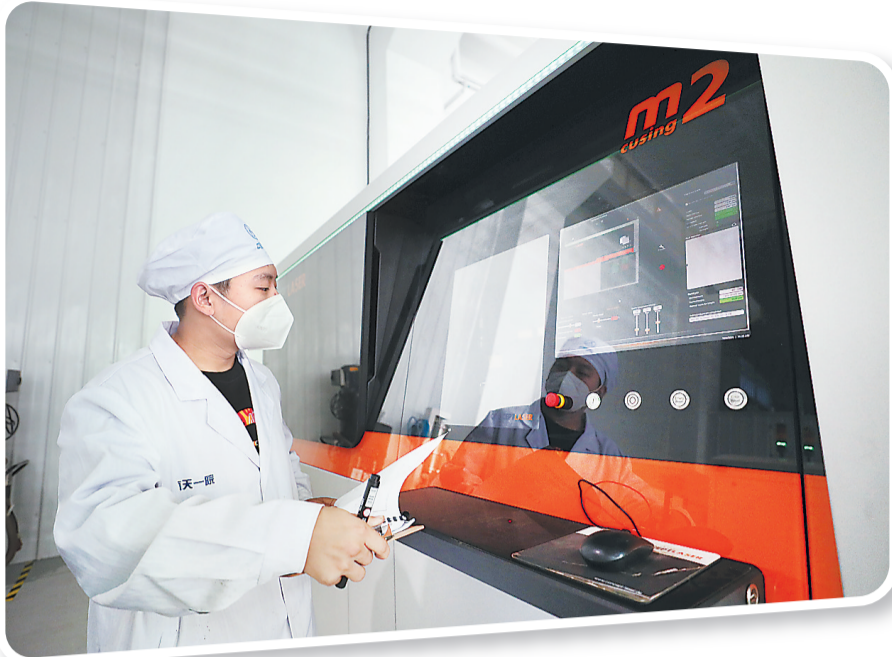
近日,在首都航天机械有限公司增材制造公司生产车间内,技术人员正在操作3D打印设备。