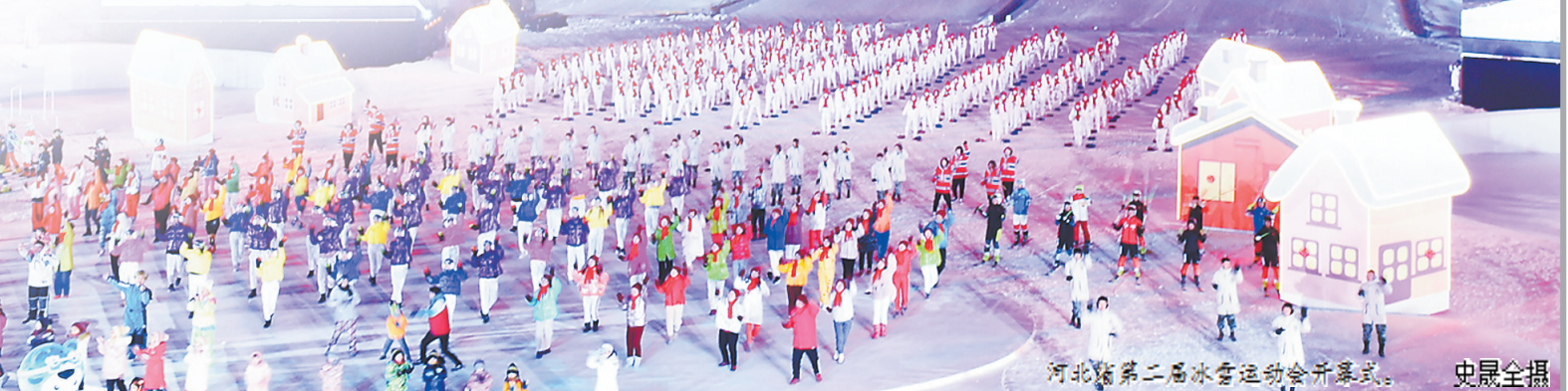
河北省第二届冰雪运动会开幕式。