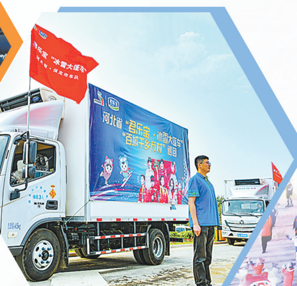
▶ 乐居宝“冰雪大篷车”驶向社区、乡村和学校。