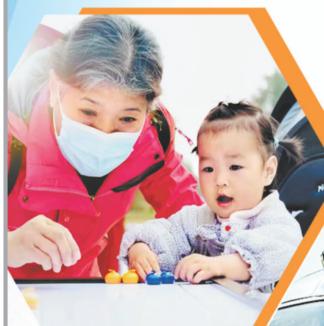
▲“冰雪大篷车”进社区，祖孙共同体验冰上冰壶。