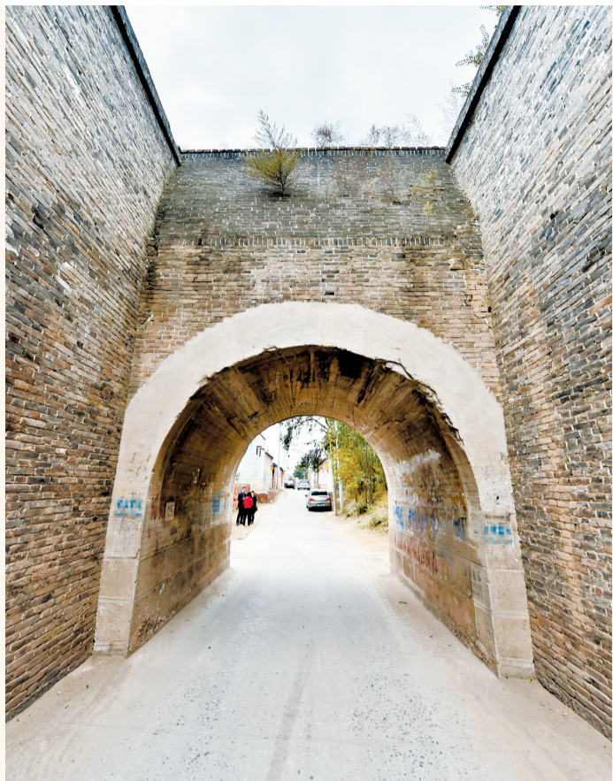
位于邢台市清河县的贝州城遗址。

出清河县城，驾车向西北方向行进，不过4公里，一座沧桑挺拔的古城闯入眼中——贝州城遗址到了。