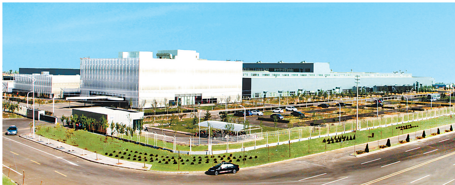
▲南山产业园外景。 河北日报通讯员 梁海泉摄 ▼沃尔沃发动机生产车间。 河北日报通讯员 梁海泉摄 ▼领克汽车焊接车间。 河北日报通讯员 崔银娟摄

目前,该县南山汽车产业集群共入驻26家与汽车相关的企业,已成为全市确立的4个、全省确立的107个重点产业集群之一。今年1至5月,该集群共实现工业总产值95.9亿元,同比增长21.5%;实现主营业务收入98.2亿元,同比增长28.1%;完成税收5.1亿元,同比增长43.2%;实现出口总值1.49亿美元,同比增长433%