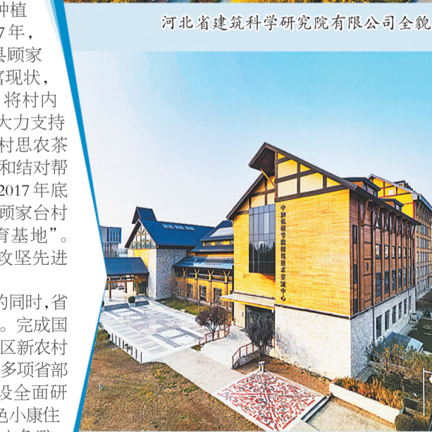
中加低碳节能建筑示范项目