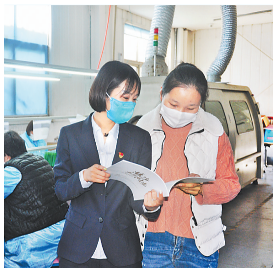
邮储银行廊坊市分行向固安恩喜友电路板有限公司发放小微企业贷款929万元并予以利率优惠,大大降低了企业的融资成本。