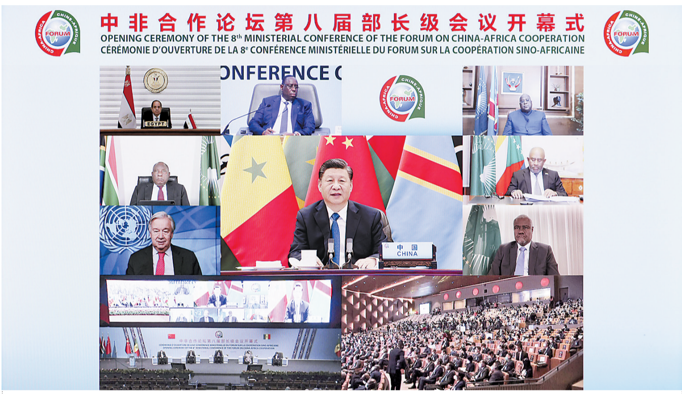
11月29日晚,国家主席习近平在北京以视频方式出席中非合作论坛第八届部长级会议开幕式并发表题为《同舟共济,继往开来,携手构建新时代中非命运共同体》的主旨演讲。

新华社北京11月29日电(记者郑明达)国家主席习近平29日晚在北京以视频方式出席中非合作论坛第八届部长级会议开幕式。人民大会堂东大厅内,中国和53个非洲国家国旗以及非洲联盟旗帜组成的旗阵恢弘大气、热烈奔放,昭示着中非历史