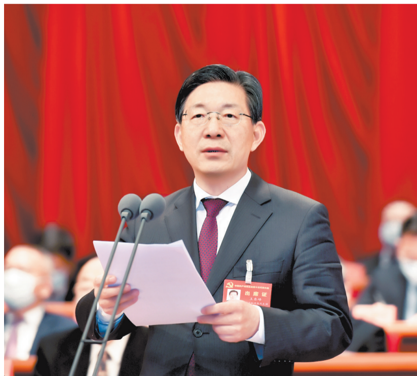
11月29日,中国共产党河北省第十次代表大会在石家庄胜利闭幕。王东峰同志主持大会并讲话。河北日报记者 赵海江摄