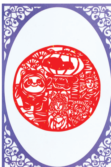
北京2022年冬奥会和冬残奥会青少年绘画作品征集活动作品。

据介绍,为进一步激发青少年参与冬奥的热情,落实“以运动员为中心”的理念,2021年9月1日开始,北京冬奥组委新闻宣传部会同教育部中外人文交流中心、北京市关心下一代工作委员会等有关单位,开展了北京2022年冬奥会和冬残奥会青少年绘画作品征集活动。3个月内,共征集到来自31个省市自治区以及香港特别行政区、澳门特别行政区和台湾地区的超过43000幅青少年绘画作品。