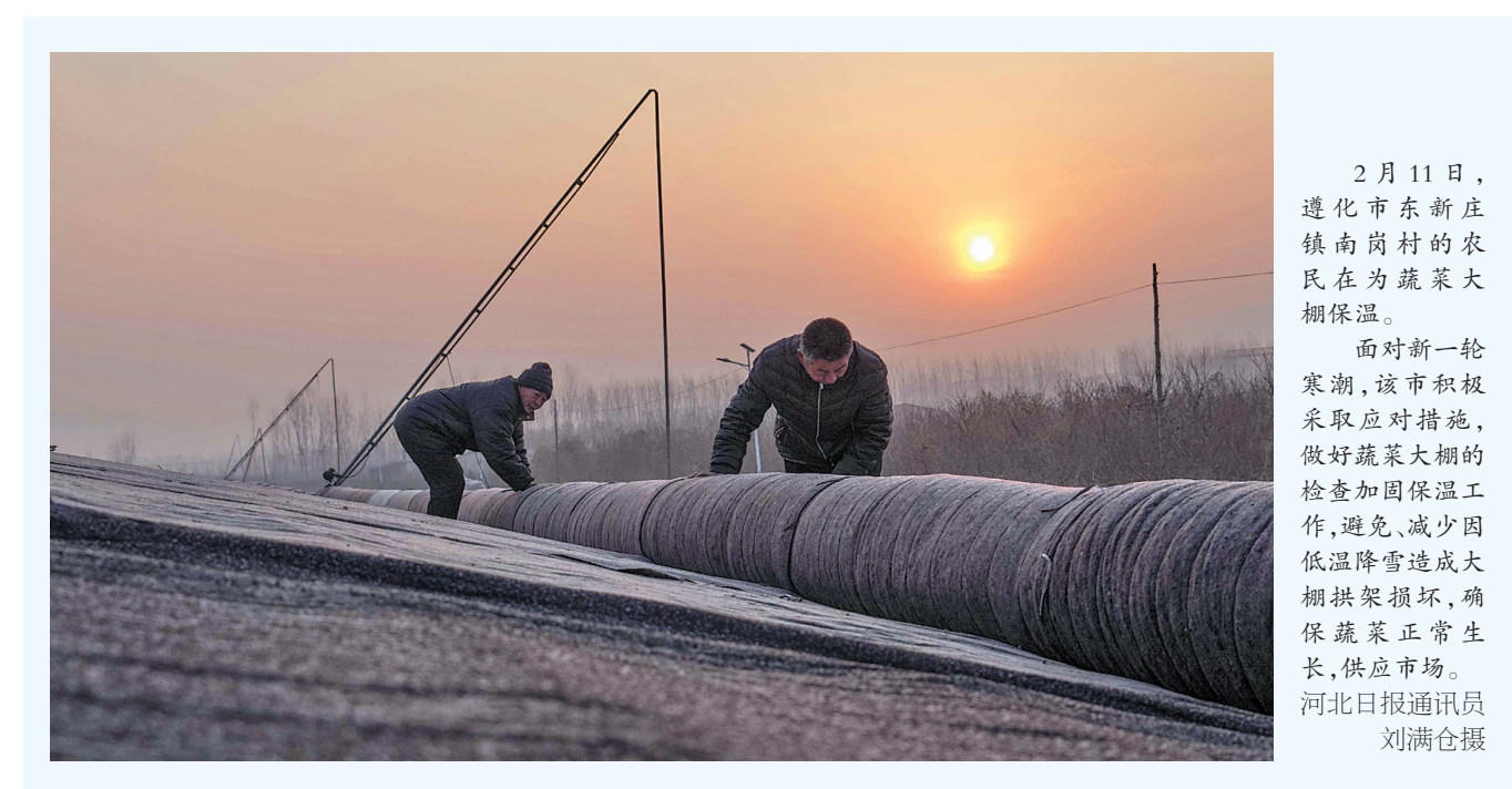
2月11日,遵化市东新庄镇南岗村的农民在为蔬菜大棚保温。面对新一轮寒潮,该市积极采取应对措施,做好蔬菜大棚的检查加固保温工作,避免、减少因低温降雪造成大棚拱架损坏,确保蔬菜正常生长,供应市场。

积极落实各项防灾减灾关键技术措施。各地要加强冬小麦分类管理,指导种植户及时采取保温保墒措施,确保冬小麦安全越冬。设施蔬菜要及时检修加固温室大棚等设施,及时清理积雪,防止垮塌,调控温度湿度,增强保温抗寒能力,有条件的及时补光,促进蔬菜生长发育。落实棚圈加固、幼仔畜禽保育、饮水系统防冻以及饲料储备调运等措施,指导养殖户适当增加能量饲料配比,提高畜禽抗寒能力。提高养殖池塘水位,适时破冰除雪,尽快将不耐寒养殖品种转移至温棚(室)。及时提醒渔船回港避风,对水产养殖设施加强巡查防护,避免受损。