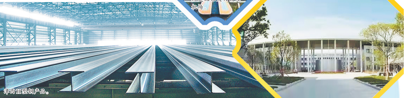
津西型钢产品亮相雄安新区市民服务中心