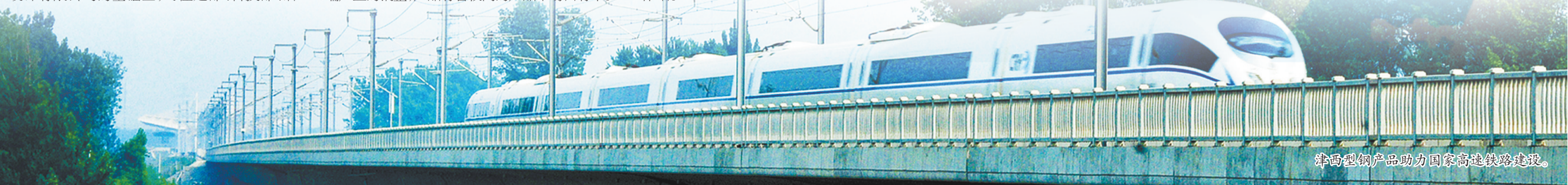
津西型钢产品助力国家高速铁路建设