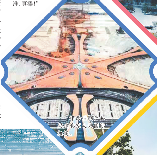
津西型钢产品助力北京大兴国际机场

研究,同时由生产团队论证新产品开发。该项目需要使用的Z型钢钢板桩,共17个定尺,需要符合欧标、美标,并且定制生产,时间紧、要求高,参与投标的都是国际一流企业。经过近两个月的刻苦攻关,历经无数次试验、调试、改进,津西成功研发出该项目所用的Z型钢钢板桩产品,使用的材质能够确保零下30℃严苛条件下的冲击力,一举打破欧美技术垄断,实现中国钢材此类高端产品亮相国际舞台。津西还为此次Z型钢钢板桩客户组建了全方位服务团队,在保证热轧Z型钢钢板桩供货通畅的同时,为其提供全方位的迅捷服务。国外检验专家细致检验产品后,竖起大拇指说道:“津西热轧Z型钢钢板桩全部符合最苛刻的欧美标准,真棒!”