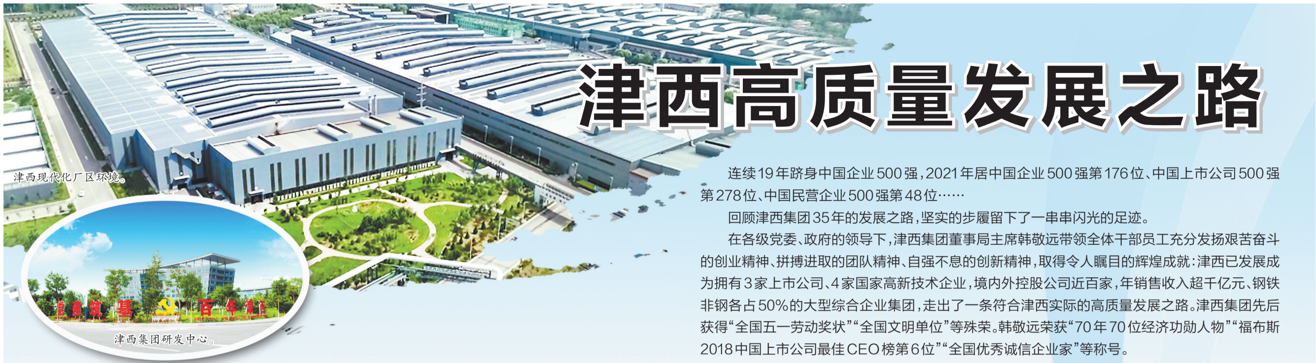
津西现代化厂区环境