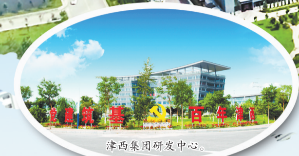
津西集团研发中心