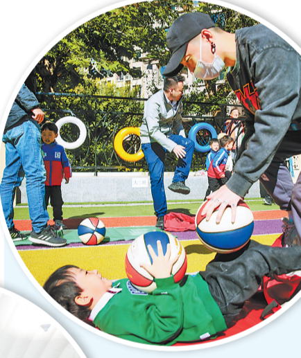
▲秦皇岛大力推动普惠性民办幼儿园发展,解决入园难问题。这是秦皇岛一民办幼儿园在开展亲子运动会。

道路畅通项目。 完善城市干线路网系统,接续打通断头路,提升城市道路承载能力。民族路南延伸工程、河北大街东段新开河桥建设工程、西三村配套规划四路建设工程、法云寺东路建设工程年内开工,燕山大街西延伸工程年内完工。