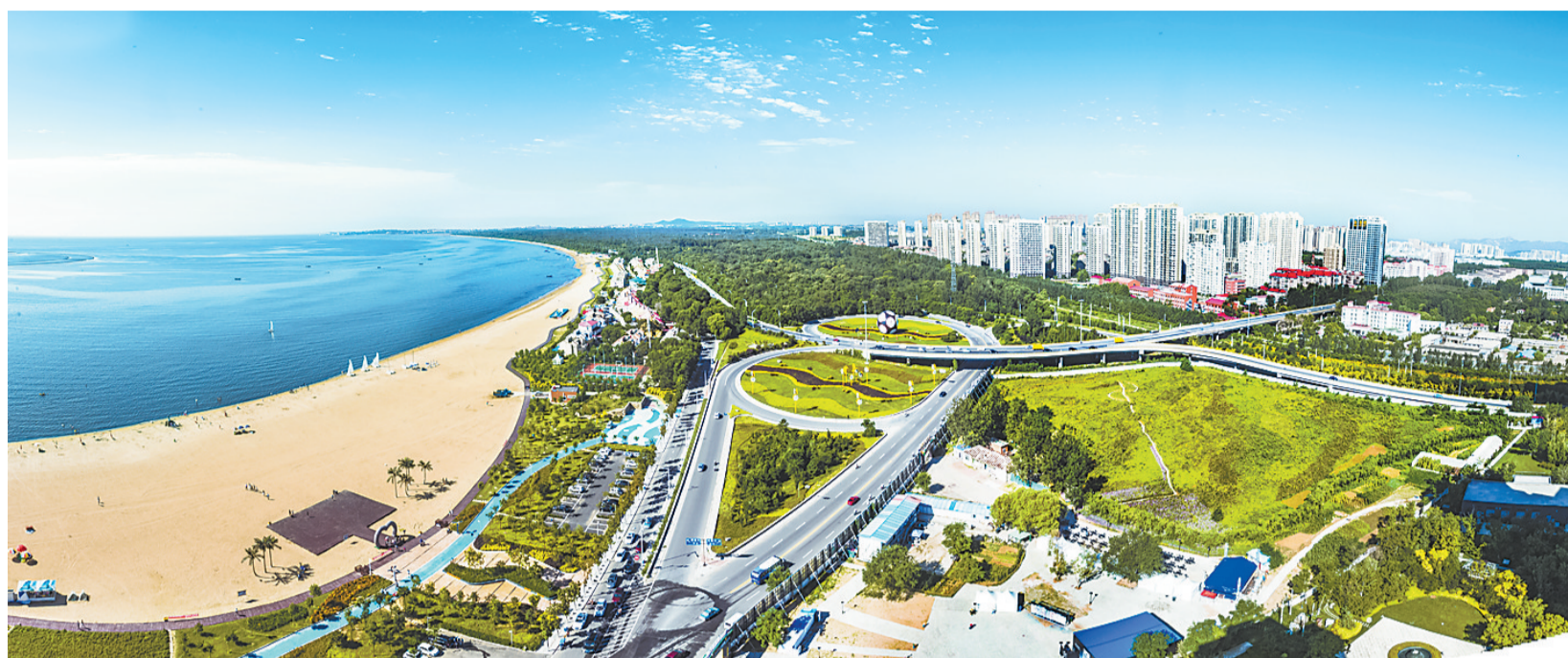
今年,秦皇岛实施21项民生实事项目,不断满足人民对美好生活的新期待。

新开工8个棚户区改造项目1657套,改造老旧小区61个,新建口袋公园、小微绿地40个,新建、改扩建中小学校10所,建设农村公厕450座,全市城镇新增就业52520人