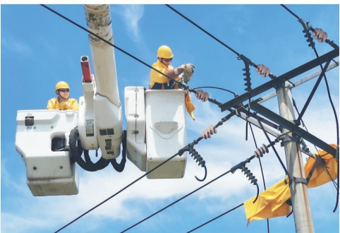
近日，邢台市南和区供电公司带电作业班组对10千伏061东韩线实施带电作业。近年来，该公司不断创新服务方式方法，成立了带电作业班组，最大限度减少用户停电时长，助力经济社会发展。

截至目前，该县基层社会治理典型案例讲评已开展5期，集中讲评各类典型案例60件，解决农村经济纠纷、非法占地、非法盗采砂石资源等方面问题41个，正在协调解决土地确权、违规建房、征地补偿等问题19个。