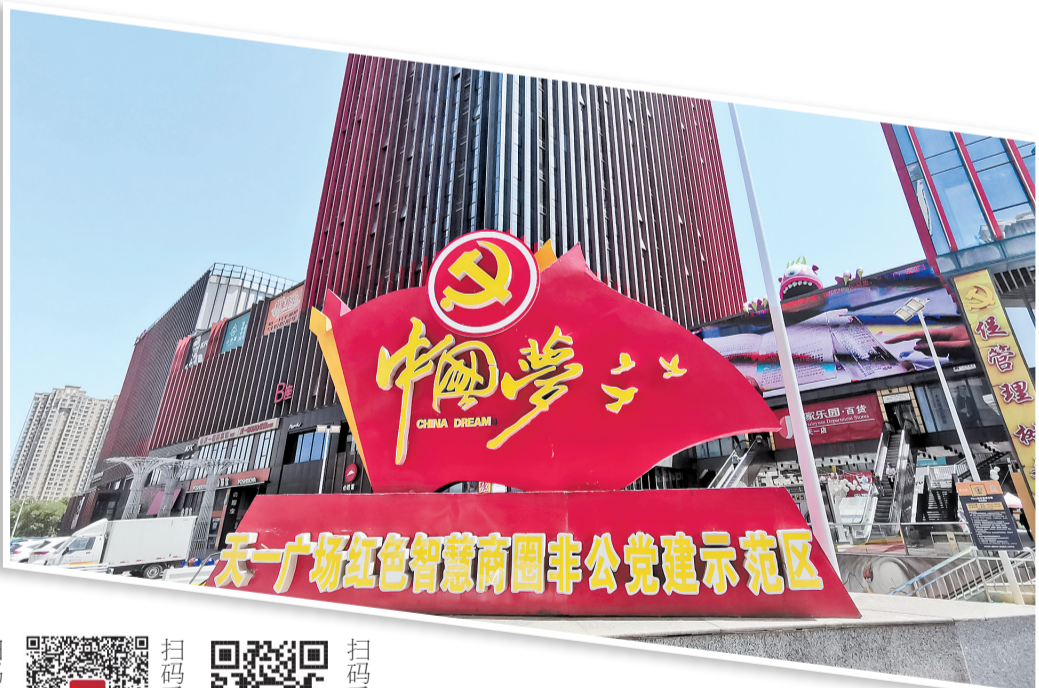
充满活力的襄都区天一城商圈。