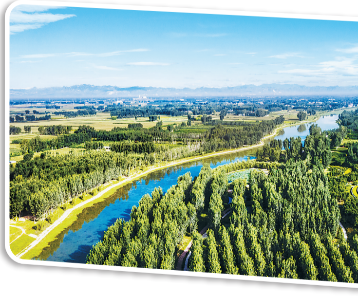
定兴县滨河公园。