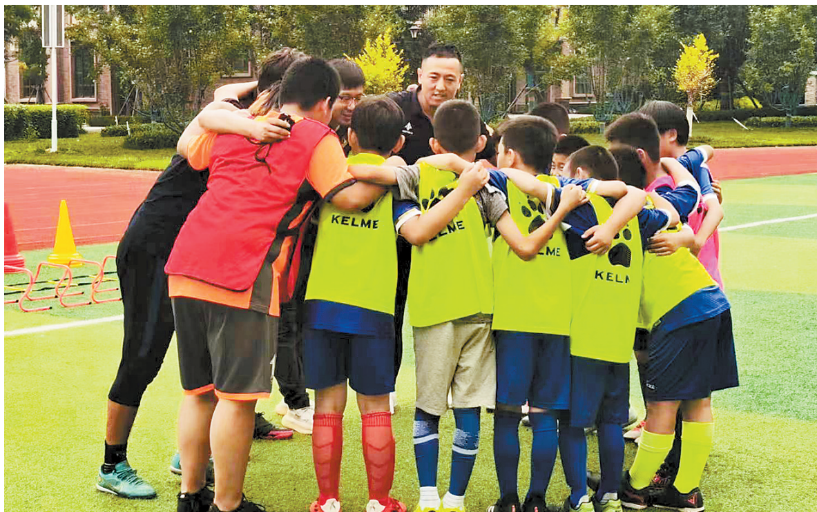
石家庄市南高营小学暑期托管学生正在操场准备踢足球。

闹十足。操场上,孩子们跟着教练一起做运动、踢足球;教室内,孩子们随着欢快的音乐声,一起舞动身体、伸展四肢。“在学校有这么多小伙伴一起玩,我特别开心。”一年级的一位小学生笑着说。