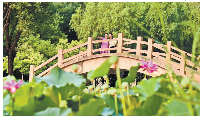
7月初,邢台市南和区和阳信镇和园内荷花盛开,吸引周边居民前来欣赏游玩。邢台市南和区在推进人居环境建设中,对废弃砖窑、污水坑塘等进行综合治理,建成了多座生态公园,有效改善了居民的生活环境。