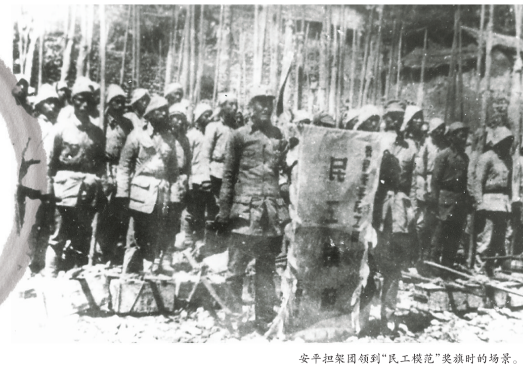
安平担架团领到“民工模范”锦旗时的场景。