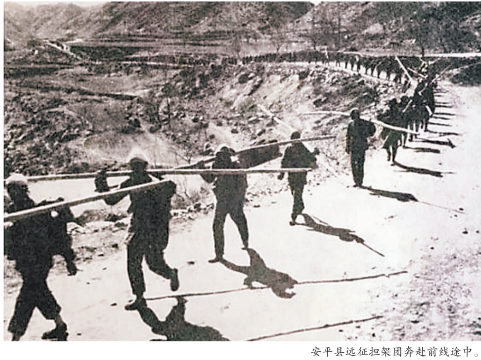
安平县远征担架团奔赴前线途中。