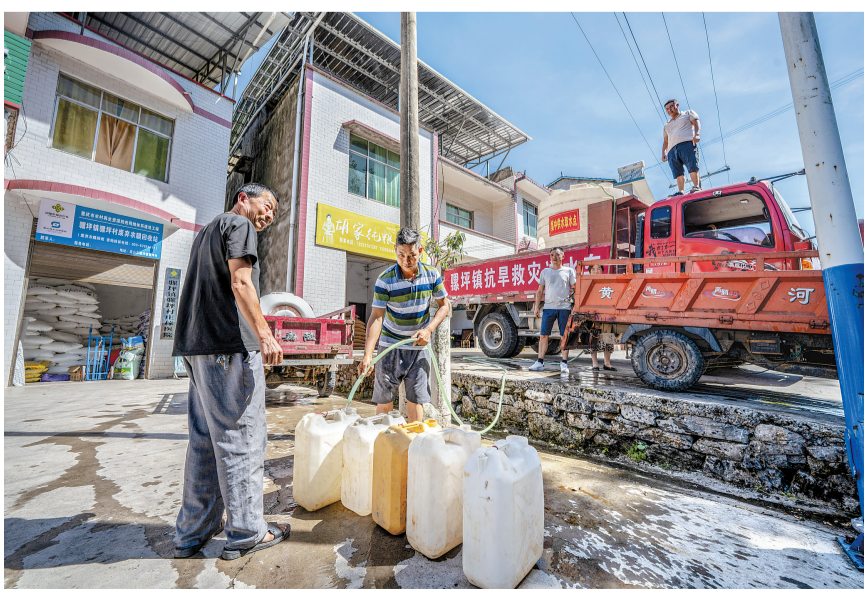
8月13日，在重庆市巫山县骡坪镇骡坪村，村民在集中供水点取水。

根据中央气象台预报，未来10天（8月17日至26日），四川盆地、江汉、江淮、江南等地仍有持续性高温天气，累计高温日数可达7至10天；上述地区最高气温可达35℃至38℃，局地可超过40℃。综合研判，此次区域性高温事件的持续时间将会继续延长，综合强度将进一步增强。