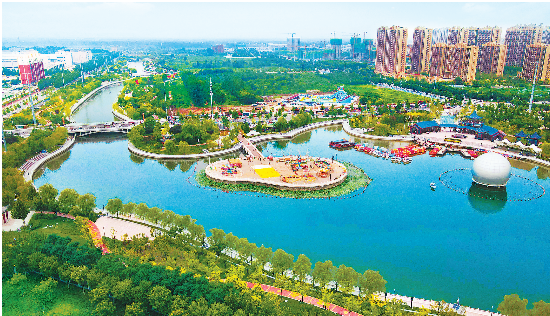
御龙河周边形成了自然资源与城市活力相统一、环境修复与城市特色相融合的美丽景观。

夜幕降临,华灯初上。廊坊市安次区御龙河公园热闹非凡。独具特色的滨水世界让人心旷神怡,忙碌了一天的人们汇聚于此,或乘船夜游、观赏璀璨绚丽的灯光秀,或逛夜市、品美食,在“烟火气”中卸下一天的疲惫。