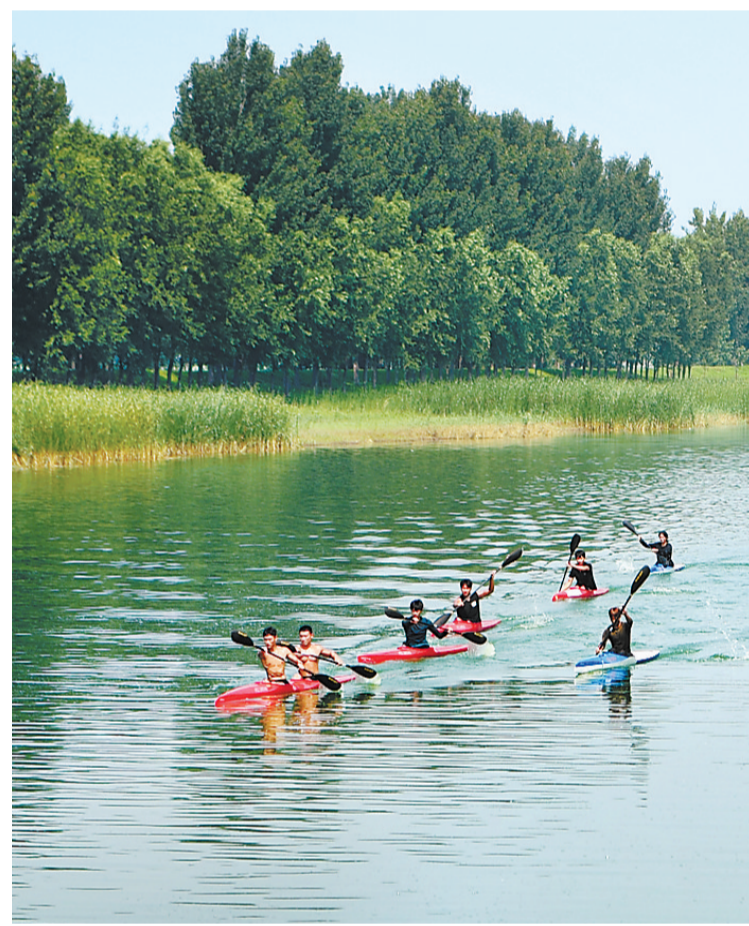
廊坊市校皮划艇队员在进行训练。