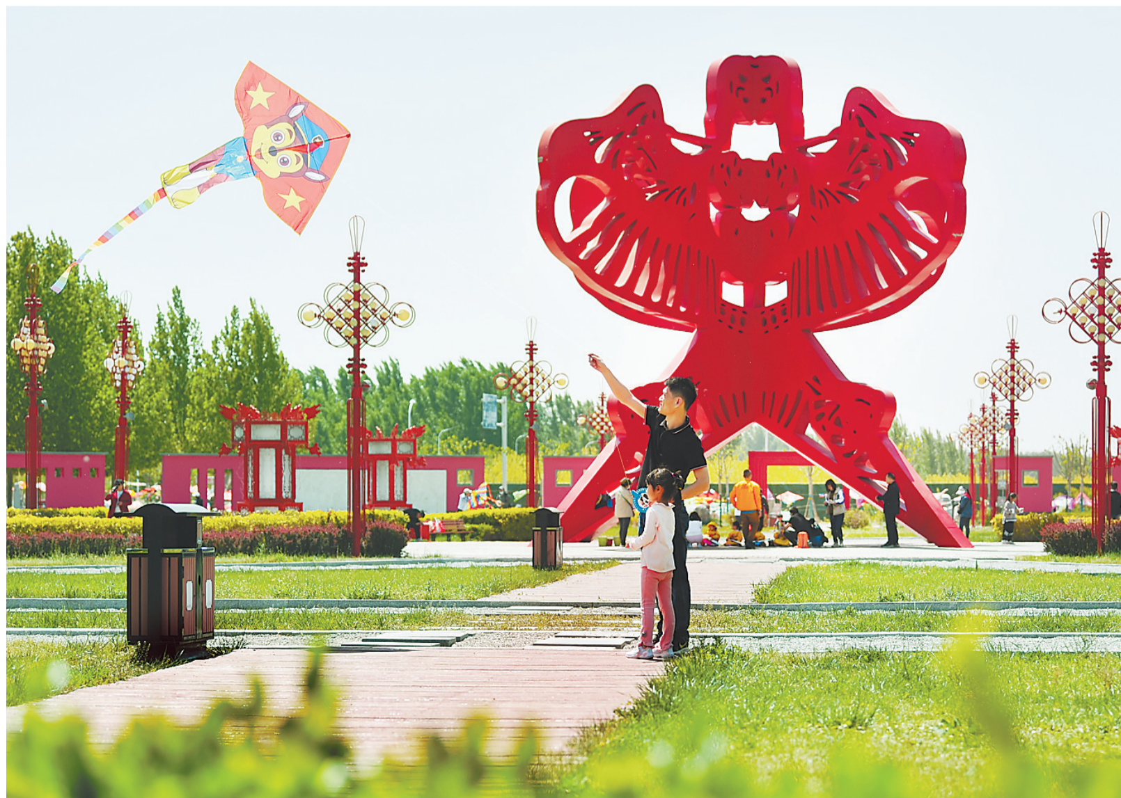
游客在第什里风筝小镇放风筝。