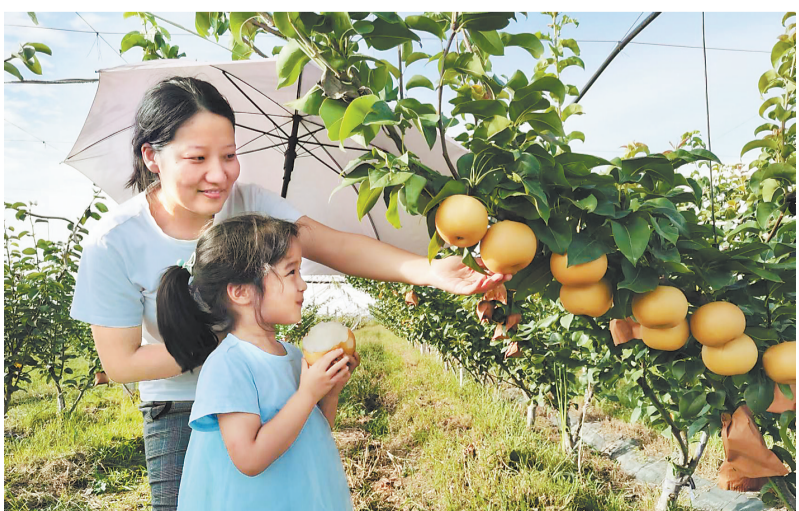
游客在廊坊市安次区蜜梨基地采摘。