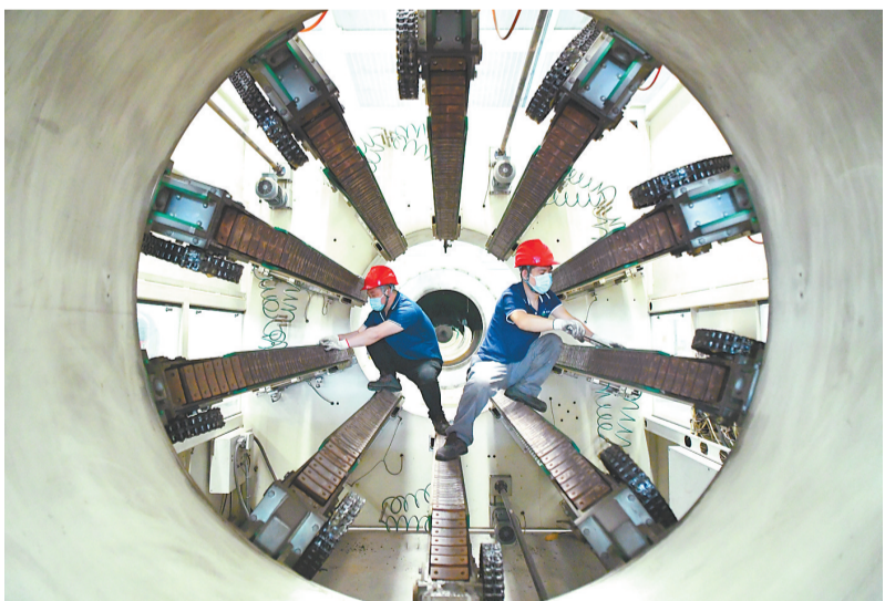
廊坊市高新区一公司生产车间内,技术人员在调试生产设备。