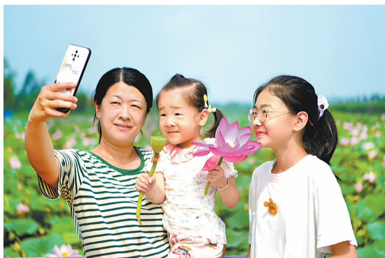
游客在落堡湿地荷塘园拍照留影。