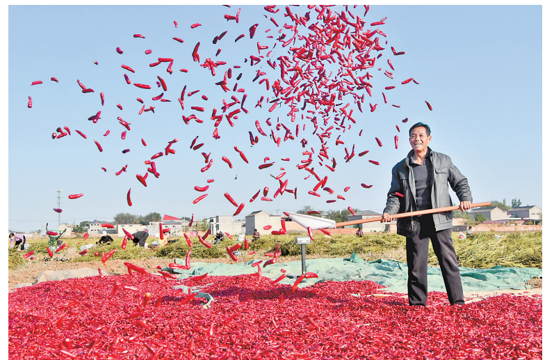
10月17日,邯郸市永年区西七急村村民在晾晒辣椒。邯郸市永年区积极调整农业产业结构,引导农民因地制宜发展辣椒特色种植,促进农业增效、农民增收,助力乡村振兴。