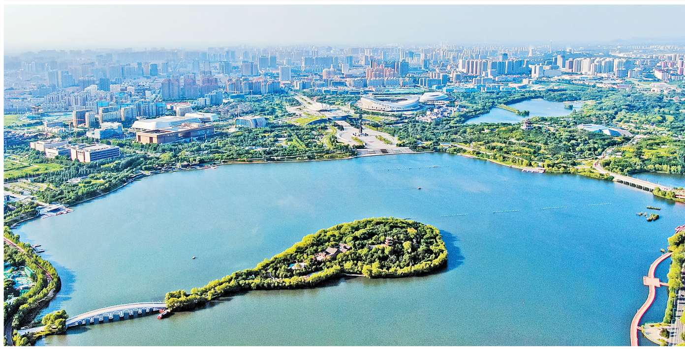
上图:无人机航拍的唐山市南湖景区。中图:中车唐山公司铝合金车体数字化生产线。