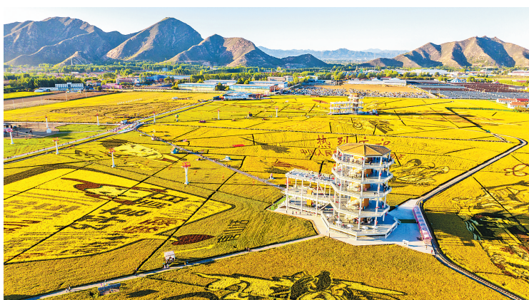
千亩稻田画成了景观农业新亮点。

乡村振兴,既要产业兴旺,又要文化繁荣。“实施山里各庄村乡村振兴综合体项目,唐山文旅集团始终将保护传播唐山地方特