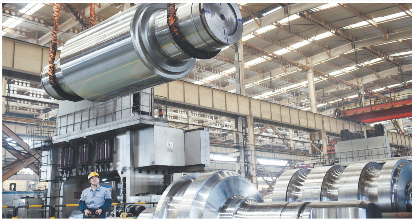
上图:中钢集团邢台机械轧辊有限公司工人在吊运轧辊。

据了解,长征汽车公司于今年6月5日起全面停产燃油车,从传统能源转向氢燃料电池、纯电动等清洁能源运输技术路线,致力追求经济价值与环保价值双赢。6月