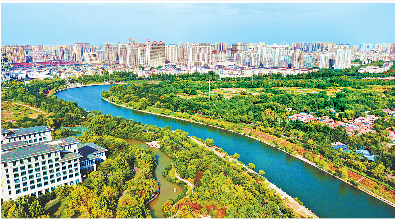
上图:蜿蜒的滏阳河犹如玉带在衡水市区穿行。

多举措提振消费。实施消费提质升级工程，布局发展康养旅游、研学旅游、休闲旅游等新业态，高水平举办全省首届研学旅游大会，全力创建衡水湖国家5A级景区。壮大电商产业，并实施城乡商业体系建设工程，充分挖掘农村消费潜力。