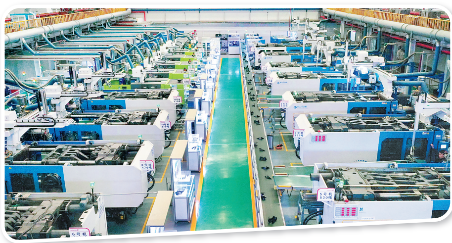
位于香河县的赛铭瑞汽车零部件(廊坊)有限公司的注塑车间。

为打造更加守约的信用环境,香河县建立与通州区信用联合激励体系,联手打造“通州北三县信用联合体”品牌,建立守信联合激励政策制度和守信“红名单”。“红名单”企业在通州区、廊坊市办理相关事务时可享受便捷措施。此外,香河县组建防范和化解拖欠中小企业账款专项工作小组,定期深入企业督导检查,并设立举报电话和电子信箱,以有效防范和化解拖欠中小企业账款问题。