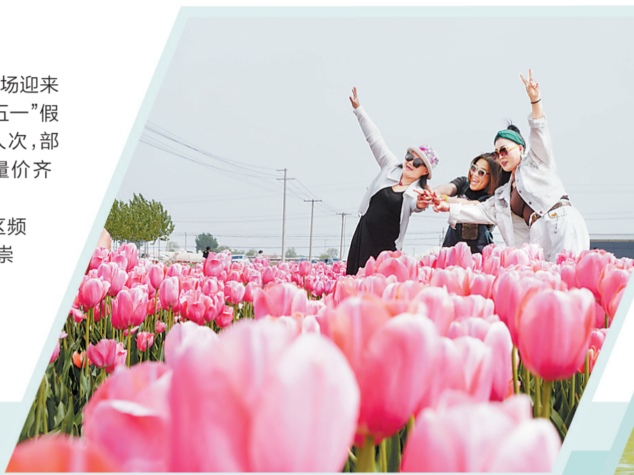
▲5月3日,游客在深南县东黄坨镇闫庄户村郁金香种植基地拍照。

从“火出圈”的淄博烧烤到各景区频频上演“抢票行情”,从文化旅游受推崇到年轻人中流行的“特种兵式旅游”,今年“五一”旅游市场有哪些新的特点和亮点?这其中,我省旅游业又呈现出怎样的态势?