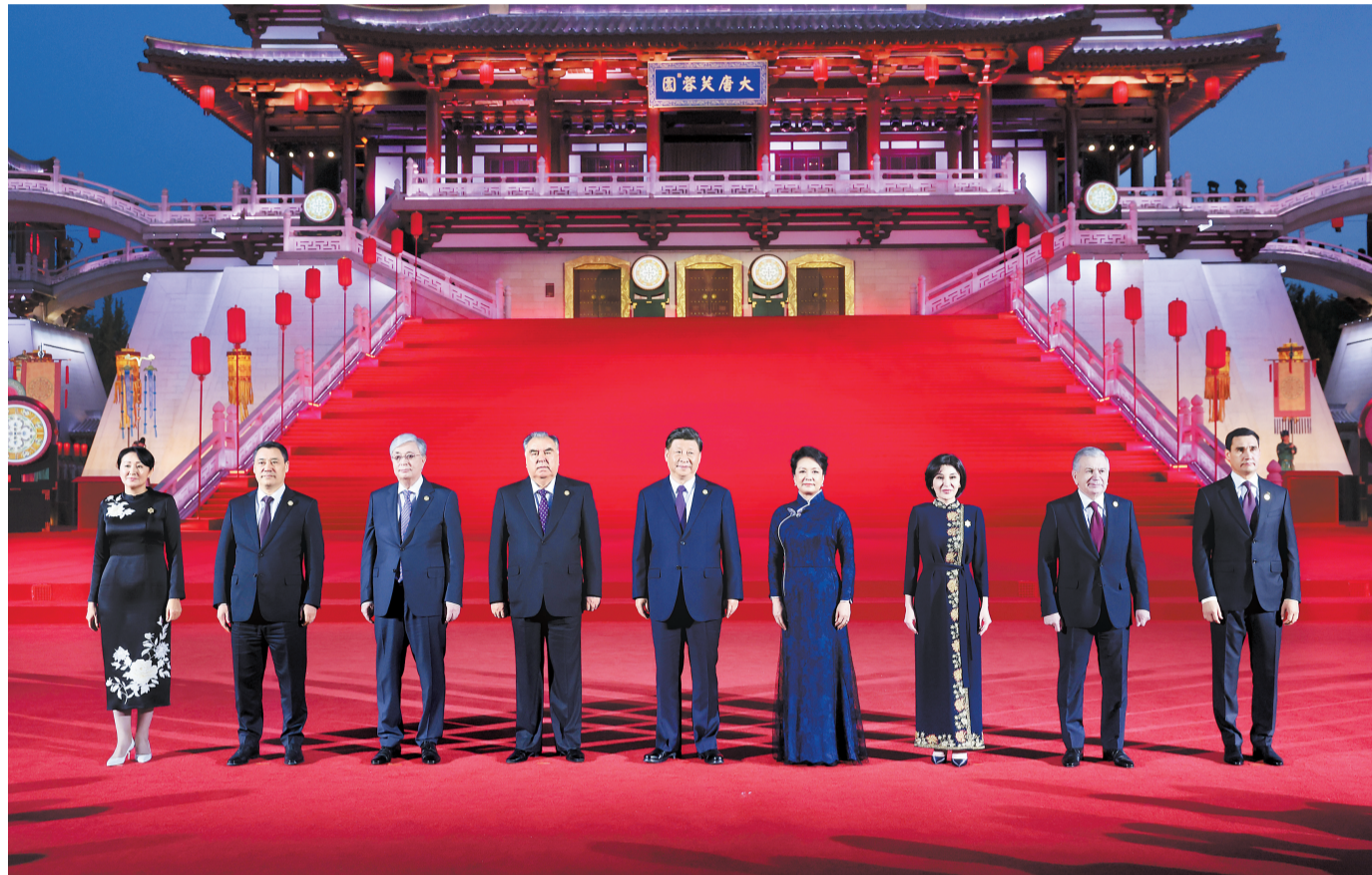
5月18日晚,国家主席习近平和夫人彭丽媛在陕西省西安市大唐芙蓉园为出席中国—中亚峰会的中亚国家元首夫妇举行欢迎仪式和欢迎宴会。宴会后,习近平夫妇同贵宾们共同观看中国同中亚国家人民文化艺术年暨中国—中亚青年艺术节开幕式演出。这是习近平夫妇在紫云楼前同贵宾合影留念。

新华社西安5月18日电(记者温馨、蔡馨逸)5月18日晚,国家主席习近平和夫人彭丽媛在陕西省西安市大唐芙蓉园为出席中国—中亚峰会的中亚国家元首夫妇举行欢迎仪式和欢迎宴会。