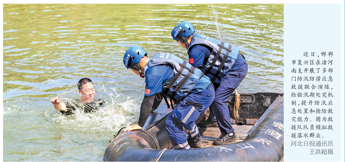
近日，邯郸市复兴区在清河南支开展了多部门防汛防涝应急救援联合演练，检验汛期处突机制，提升防汛应急处置和抢险救援能力。图为救援队队员模拟救援落水群众。

有关地区和部门要密切关注雨水情变化，强化监测预报预警，科学调度水工程，加大河道堤防巡查力度，高度关注山洪灾害，提早转移受威胁群众，确保安全生产。