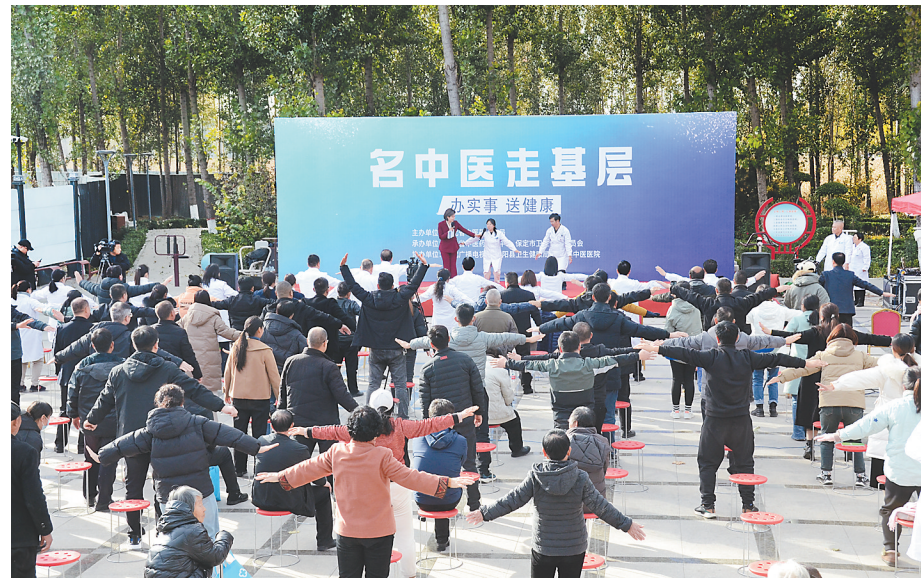
河北省“名中医走基层”活动走进保定曲阳县。

有针对性地安排医生,组织活动内容。在平山县举行的首站活动中,省中医药管理局、省中医药发展中心结合当地群众的常见病和多发病,安排了心、脑、肾、脾胃、妇科、皮肤科以及骨伤、针灸