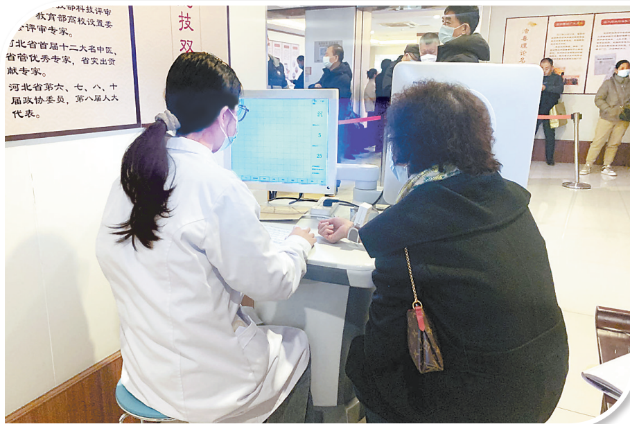
患者在省中医院CAG中医病证辅助诊疗平台上体验“就诊”。

步搭建完成,目前正在进行病历收集验证。通过建立CAG病例数据库和知识库,中医病例大数据分析,以及“症一面一舌一脉”信息采集,初步实现了CAG病证辅助诊断和治疗支持。