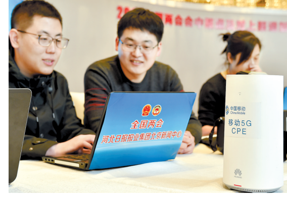
3月2日，在河北日报报业集团2019年全国两会北京新闻中心，5G用户前置设备运行平稳，记者们在5G网络环境下处理稿件。

新闻中心正面上安装的大屏幕十分吸睛。这是一个长6m宽2.4m的4K高清LED拼接液晶屏，正不间断播放着河北日报全国两会原创融媒体报道。这里是集团设立的全媒体采编平台，中央厨房分中心，通过视频连线，前后方可及时在线沟通交流，对全国两会报道进行安排调度。在河北省代表团驻地，河北日报报业集团全国两会专题报道融媒体展示大屏，受到我省代表们的欢迎，代表们纷纷点赞：党报集团的融合传播创新多、效果好。