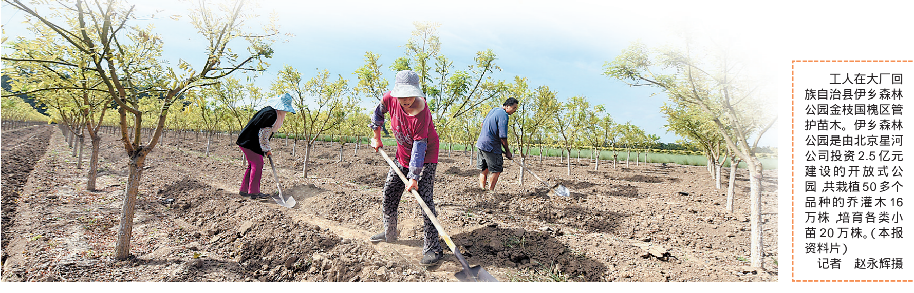
工人在大厂回族自治县伊乡森林公园金枝国槐区管护苗木。伊乡森林公园是由北京星河公司投资2.5亿元建设的开放式公园，共栽植50多个品种的乔灌木16万株，培育各类小苗20万株。

李成贵说，京津冀三地产业选择及对环境目标的要求不一致等问题，一定程度上影响着三地生态治理进程。李成贵说，今年的政府工作报告中首次提到，要协调推进高质量发展与生态环境保护。三地应在这方面加大研究，率先探索，形成生动实践。要明确环保和经济发展并非此消彼长。我了解到，瑞典从1990年到2010年，二氧化碳排放量减少了20%，而同一时期经济增长了60%，这进一步佐证了这个观点。他建议，三地统一观念，设定更加系统全面的环保目标，统一执法标准，确保不符合环保要求的产业在京津冀范围内皆无法落地。如何创新机制，实现京津冀三地联防联控？李成贵指出，应探索京津冀三地跨行政区域的自然资源综合管理利用。应借鉴先进国家经验，加强研究，着力从自然资源管理的角度创新制度，进行政策安排。其次，要进一步细化相关规划和法规政策，力争做到对所有生态环保问题处处有定义，处处有详尽的解释和解决办法，以便更好落地执行。此外，还要充分运用市场机制，研究推进碳汇交易、水资源利用补偿、土地资源异地置换等重大问题，协调好三地的利益关系，实现生态保护与经济发展的双赢。