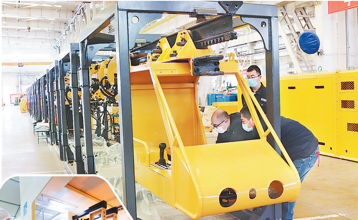
▲冀中装备集团石煤机公司利用技术创新危中寻机制订单。这是近日技术人员在调试新型大功率单轨吊。