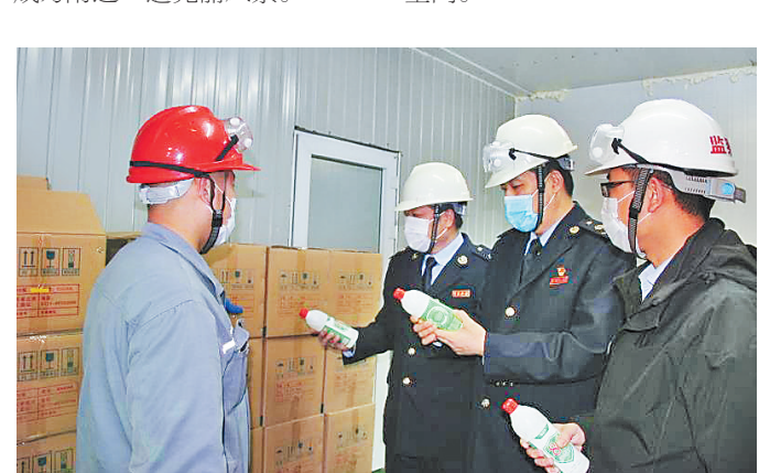
日前,石家庄循环化工园区落实税收优惠政策业务团队干部深入河北八维化工有限公司,查看企业享受公益捐赠等税收优惠政策落实情况,详细了解企业84消毒液产销情况,并听取企业意见建议。

松石文化特色园位于中华大街和裕华路交叉口的东北角,紧邻地铁3号线东里站。园中油松错落有致,与一块块造型别致的景石相映成趣,俨然成为附近一道亮丽风景。