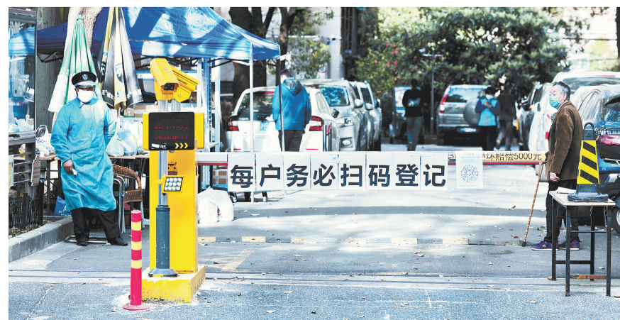
3月29日,工作人员在上海市徐汇区天平路一小区入口处执勤。

“通过分析筛查结果,我们发现上海疫情呈现区域聚集和全市散发两个特点并存,存在面上爆发的潜在风险。”吴凡说,经综合研判,有必要采取更果断、坚决的措施,进一步降低人群的社会流动性,快速排查发现感染者,着力消除病毒隐匿的社区传播。