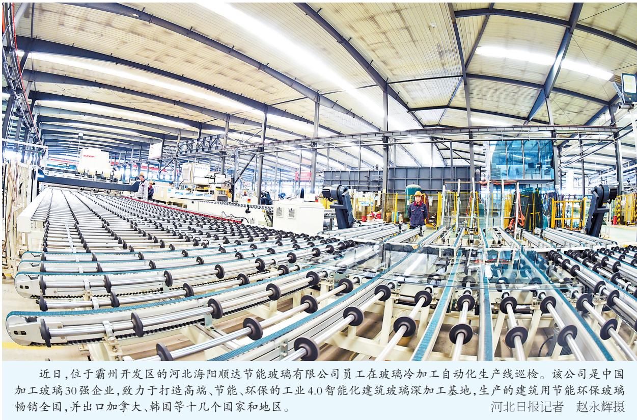
近日,位于霸州开发区的河北海阳顺达节能玻璃有限公司员工在玻璃冷加工自动化生产线巡检。该公司是中国加工玻璃30强企业,致力于打造高端、节能、环保的工业4.0智能化建筑玻璃深加工基地,生产的建筑用节能环保玻璃畅销全国,并出口加拿大、韩国等十几个国家和地区。

2021年,工信部、教育部联合开展“5G+智慧教育”应用试点项目申报工作,旨在遴选一批利用5G网络的教育信息化最佳实践和解决方案,培育一批以5G为代表的新一代信息通信技术与教育融合创新的典型案例,树立一批可复制推广、可规模应用的发展标杆。