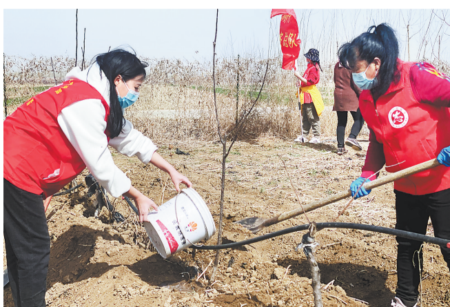
4月5日,在三河市杨庄镇中门村,40余名新时代文明实践志愿服务者开展植树、绿化、护绿、兴绿的良好风貌。这是志愿者们正在为树苗浇水。

为全力服务项目落地,广阳区行政审批局主动作为、积极对接、靠前指导,与广阳区供销社共同帮助企业梳理在广阳注册登记的各类材料,为企业办理了营业执照。3月10日,企业因疫情管控原因无法到现场,广阳区行政审批局发挥“金牌店小二”作用,为企业提供全程帮办代办服务,在免费刻章的同时,一体化启动了项目审批“绿色通道”,通过视频连线、在线指导的方式,仅用不到1个小时就帮助企业办理了固定资产投资备案手续,用工作效率赢得了企业和相关部门的赞誉,用实际行动践行了“办事不求人、服务在身边”的承诺。