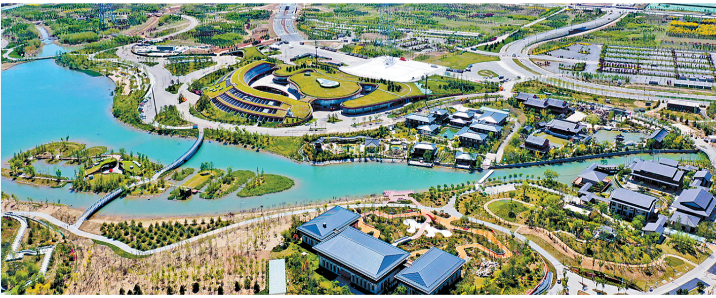
雄安新区野公园 美景入画来 近日,雄安新区野公园景色宜人,令人心旷神怡,从空中俯瞰,宛如一幅美丽的生态画卷。