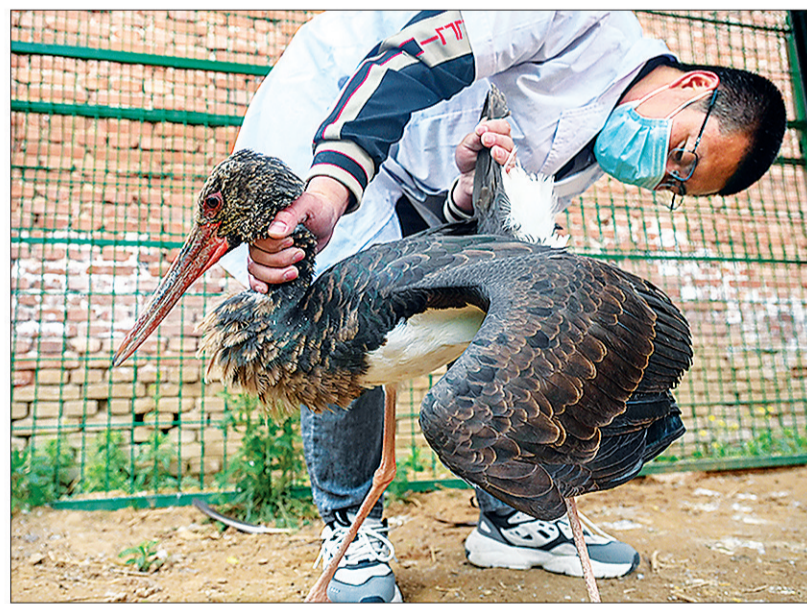
▲石家庄市野生动物救护站工作人员为即将放生的黑鹳做检查。