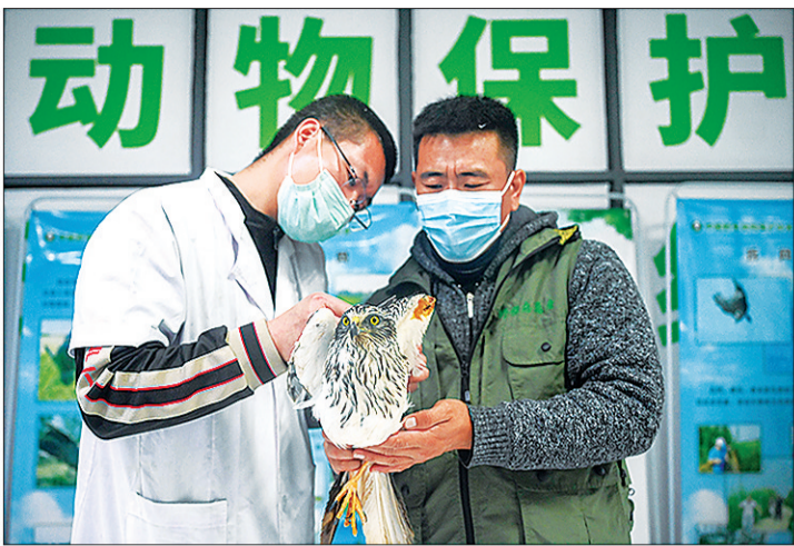
石家庄市野生动物救护站工作人员正在为受伤的白腹鸢换药。