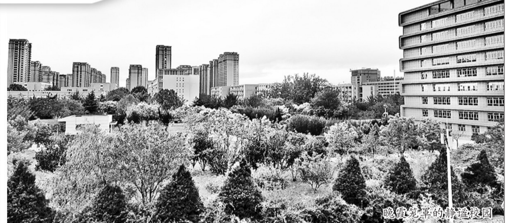
朝气蓬勃的静谧校园