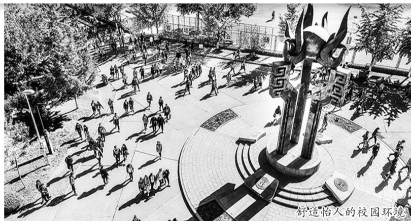
舒适怡人的校园环境