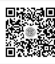
招生就业处微信公众号