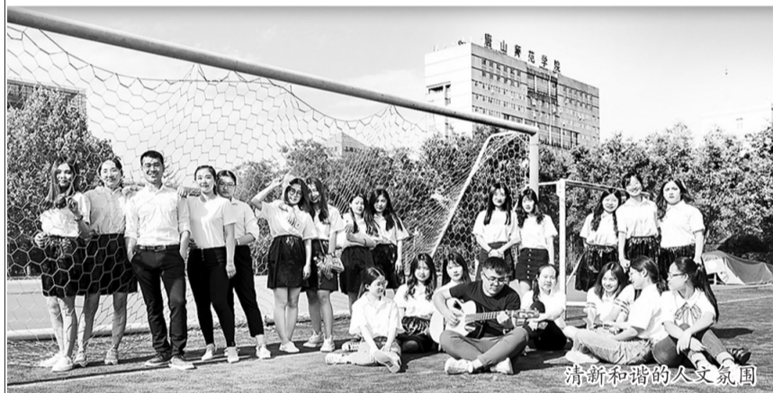
清新和谐的人文氛围