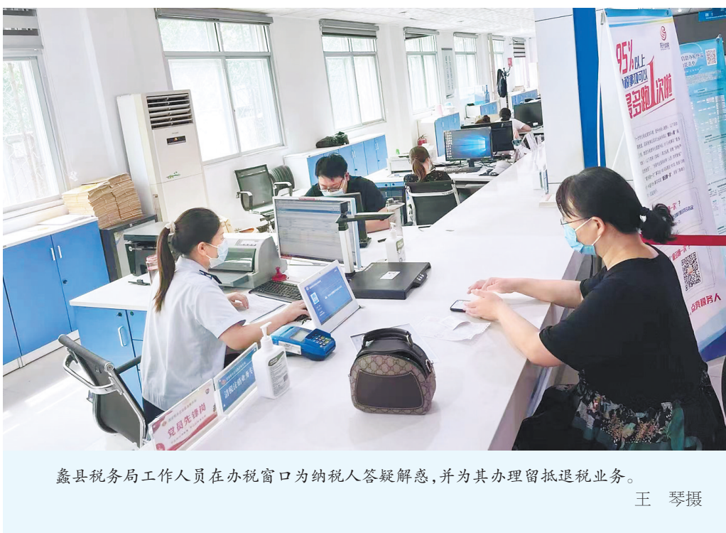
鑫县税务局工作人员在办税窗口为纳税人答疑解惑,并为其办理留抵退税业务。

近日,国务院印发《扎实稳住经济的一揽子政策措施》,全力提振经济企稳回升,为稳住经济大盘提供坚实支撑。省政府发布扎实稳定经济运行的“1+20”政策体系,有23条涉及税务部门。一揽子政策目标明确、指