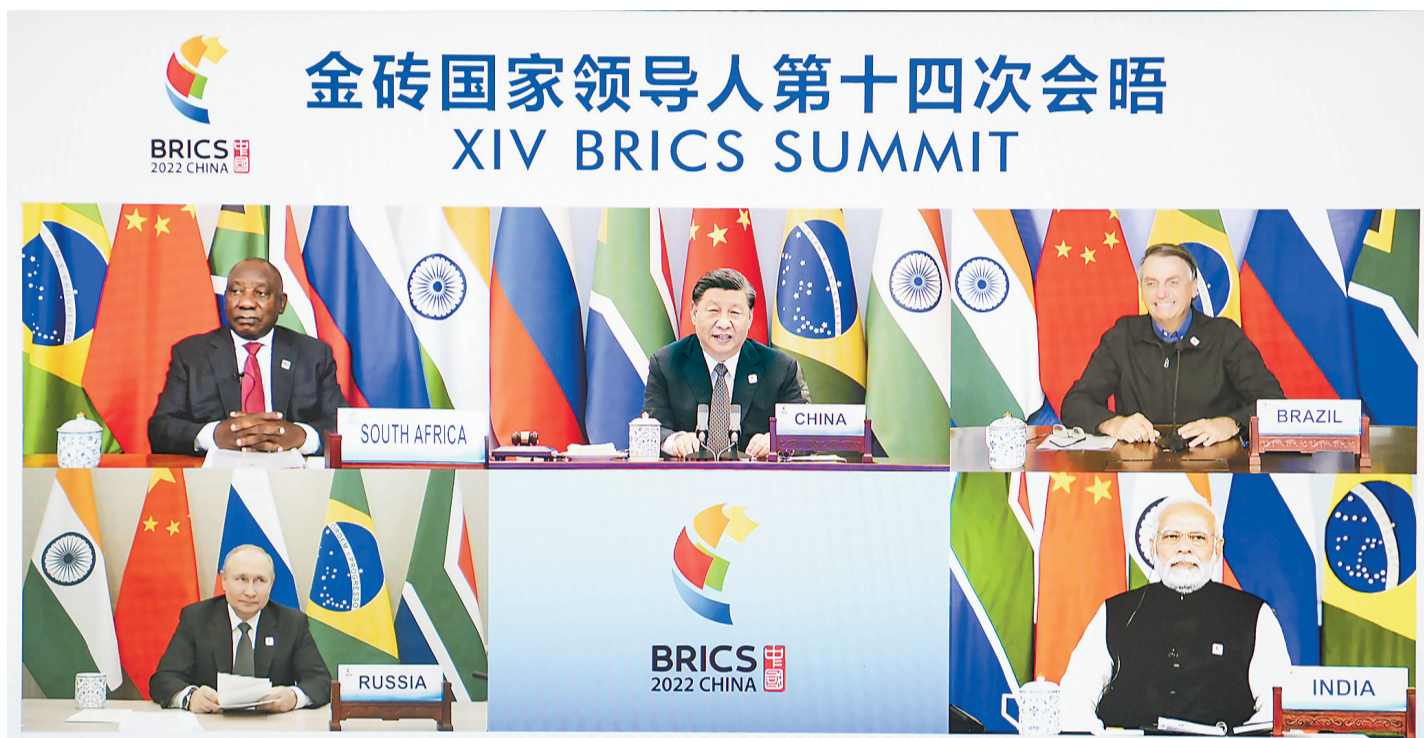
6月23日晚,国家主席习近平在北京以视频方式主持金砖国家领导人第十四次会晤并发表题为《构建高质量伙伴关系 开启金砖合作新征程》的重要讲话。南非总统拉马福萨、巴西总统博索纳罗、俄罗斯总统普京、印度总理莫迪出席。

新华社北京6月23日电(记者杨依军) 国家主席习近平23日晚在北京以视频方式主持金砖国家领导人第十四次会晤。南非总统拉马福萨、巴西总统博索纳罗、俄罗斯总统普京、印度总理莫迪出席。