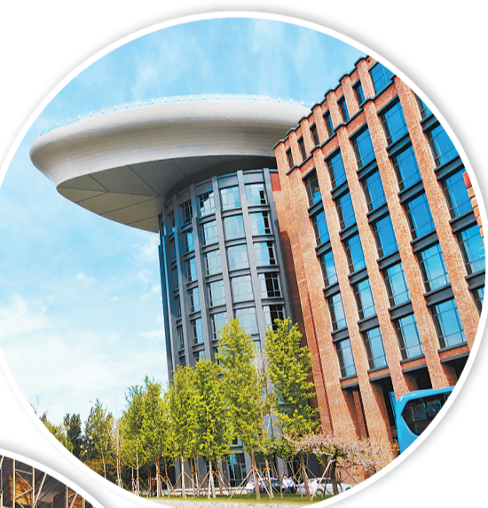
▲位于邢台市宁晋县的童泰婴幼儿服饰有限公司12层立体厂房。河北日报通讯员 章洪涛摄 ▲蒙牛乳业(滦南)有限责任公司的立体厂房。河北日报通讯员 贾彬摄 ▼位于邢台市宁晋县的童泰婴幼儿服饰有限公司“身兼数职”的厂房楼顶。河北日报通讯员 章洪涛摄

同时,我省全面压实市县主体责任,通过采取通报批评、警示约谈等措施,督促指导各地全力推进盘活利用。省自然资源厅先后印发情况通报28期,对沧州黄骅市、秦皇岛海港区、承德兴隆县等12个问题严重地区开展警示约谈,一批重点难点问题得到有效解决,有力保障