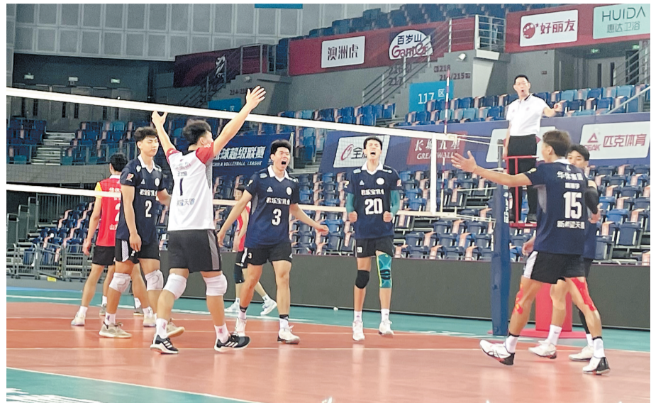
保定沃隶排球俱乐部队员与其他队伍进行教学比赛。