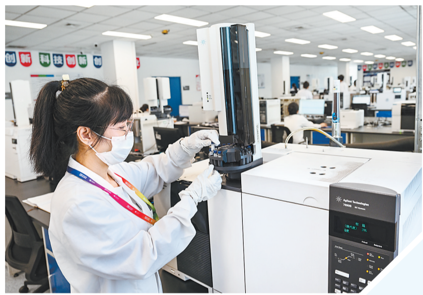
7月1日，石家庄诚志永华显示材料有限公司质检人员正在进行产品检测。

资源，开展共性关键技术研发，突破产业发展的技术瓶颈，形成一系列具有自主知识产权的创新成果，不断提升特色产业自主创新能力。