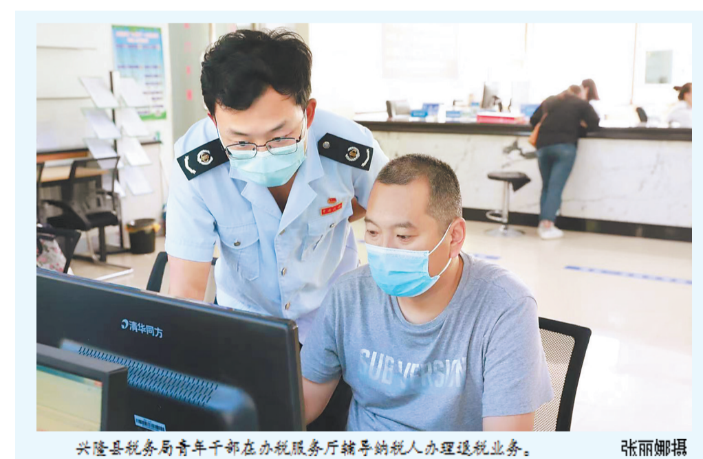
兴隆县税务局青年干部在办税服务厅辅导纳税人办理退税业务。

勇于攻坚克难，源于他们的决心。本轮组合式税费支持政策既有减税降费，又有退税缓税，既有普遍适用的减免政策，又有针对困难行业的帮扶政策，涵盖范围广、优惠力度大、各方期待高。省税务局退税减税办作为全省税务