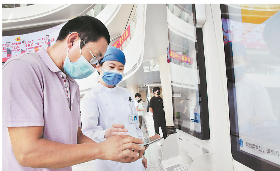
近日，患者在那台市人民医院就医。(本报资料片)

与此同时，邢台市根据测算确定了城镇职工医保每年度DIP预算总额和城乡居民医保每年度DIP预算总额，建立了医保基金超额分担机制。根据此机制，10%的机动基