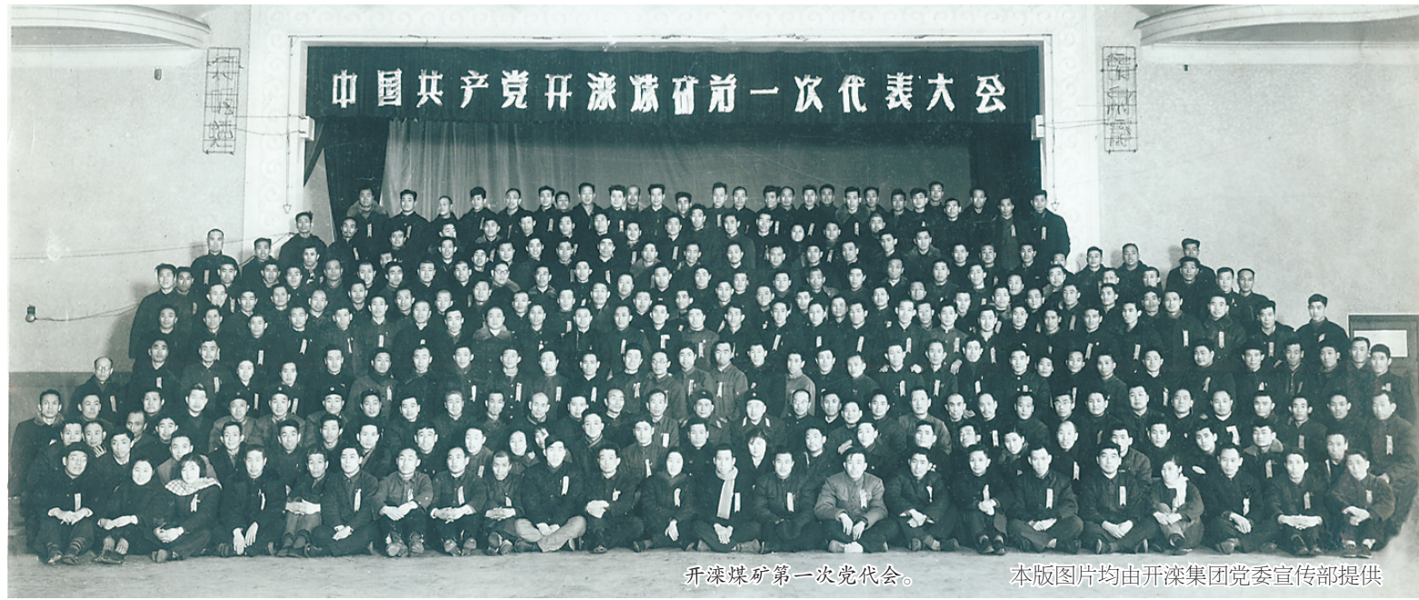
开滦煤矿第一次党代会。