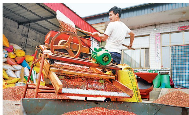
内丘县柳林镇农民在加工酸枣仁。