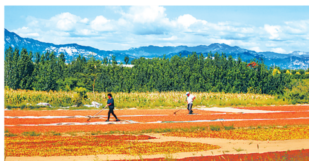
内丘县柳林镇农民在晾晒酸枣、枣核。