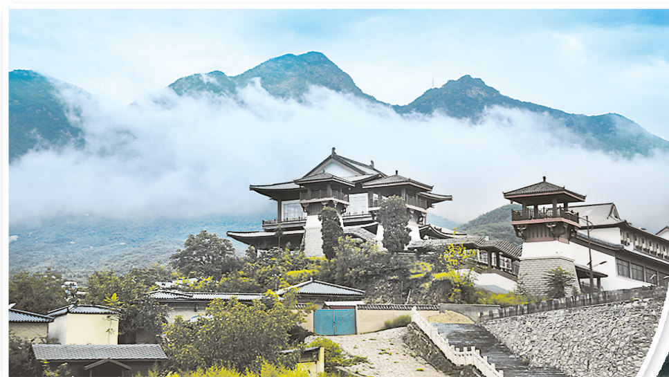
内丘扁鹊康养基地。

其次，突出产销对接。组织国内100家以上中药企业与省内100家以上规模经营主体，会前和会期通过线上线下相结合的方式开展对接洽谈；筛选有影响力的道地品种，由市、县农业农村部门或种植园区负责人开展招商推介。