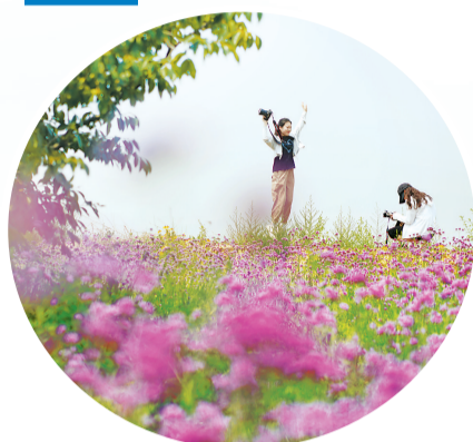
游客在扁鹊药谷花海拍照、游玩。

本届中药材产业发展大会，由河北省农业农村厅、北京市农业农村局、天津市农业农村委员会、河北省财政厅、河北省工业和信息化厅、河北省卫生健康委员会、河北省中医药管理局、河北省药品监督管理局、邢台市人民政府等部门和单位联合主办，邢台市农业农村局、内丘县人民政府承办。