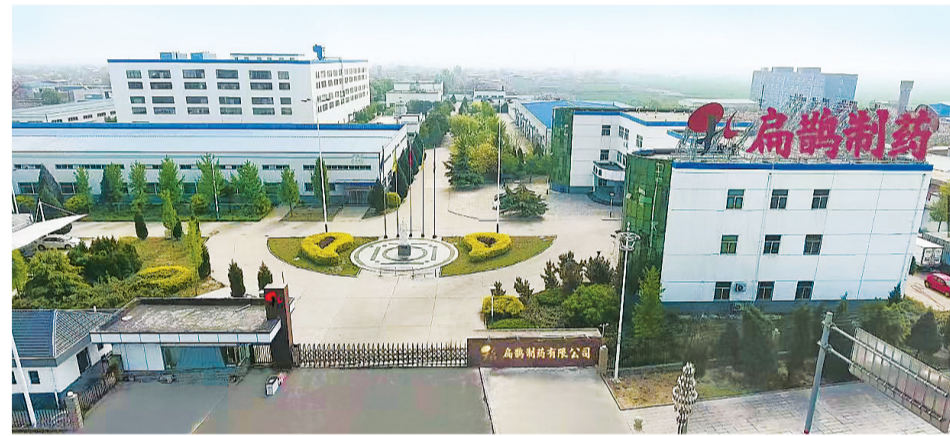
位于内丘县官庄镇的河北扁鹊制药有限公司。

出酸枣仁4000吨左右，产值达13亿元以上，销量占全国酸枣仁市场70%以上。产品大多销往安徽、亳州等中药材市场，还有部分产品出口东南亚。