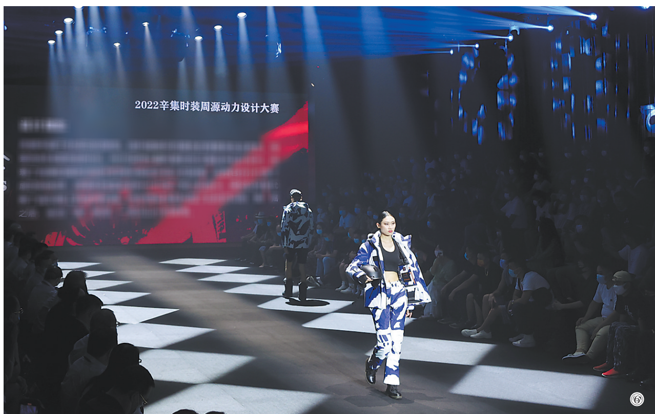
图⑥：2022辛集时装周源动力设计大赛上，一批最新设计的皮草服饰被搬上舞台，给观众带来了一场视觉盛宴。