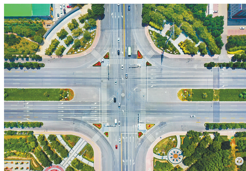
图⑦：绿意点缀的澳森大街与教育路交口。澳森大街两侧各建有88米的绿化带，让这条大道真正成为了城市的“绿廊通道”。