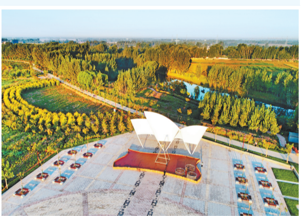
上图:美丽的大运河穿沧州城而过,成为沧州市靓丽风景线。河北日报通讯员 王 韬摄 中图:大运河沧州市区段美景。河北日报通讯员 王 韬摄